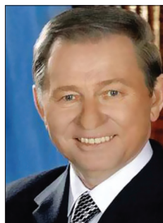
Президент України Леонід Данилович Кучма 1994–2005 рр.